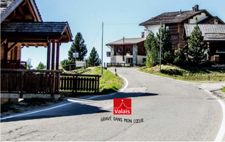
Valais - Le Village de Chandolin - 2017

LE CHARMANT VILLAGE DAS CHARMANTE DORF THE CHARMING VILLAGE