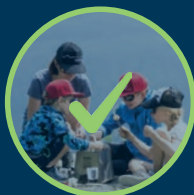
EINE GENUSSWANDERUNG IN CHANDOLIN