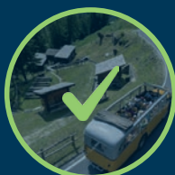
EINE PANORAMAFAHRT IM HISTORISCHEN BUS