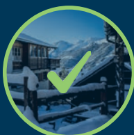
EINE GEFÜHRTE BESICHTIGUNG DES DORFS ST-LUC