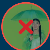
EINEN REGENSCHIRM FÜR SCHLECHTWETTER