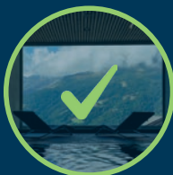
EINEN EINTRITT IN DIE BÄDER DES HOTEL CERVIN