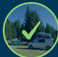
UN EMPLACEMENT DE CAMPING À GRIMENTZ