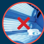
UNE SESSION DE SOLARIUM