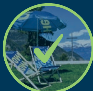
UN TRANSAT VAL D'ANNIVIERS