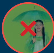
UN PARAPLUIE EN CAS DE MAUVAIS TEMPS