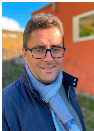
Par Vincent Epiney Membre du Conseil d'Administration