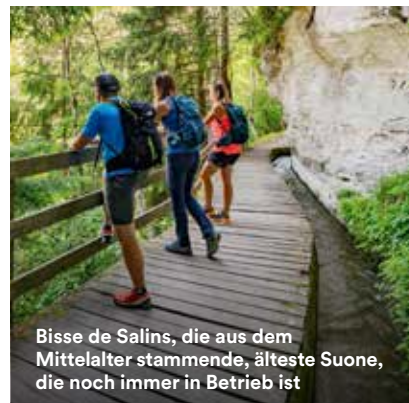
Bisse de Salins, die aus dem Mittelalter stammende, älteste Suone, die noch immer in Betrieb ist