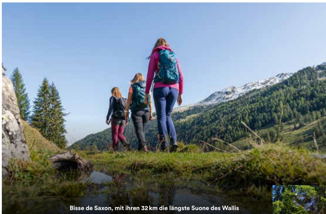
Bisse de Saxon, mit ihren 32 km die längste Suone des Wallis