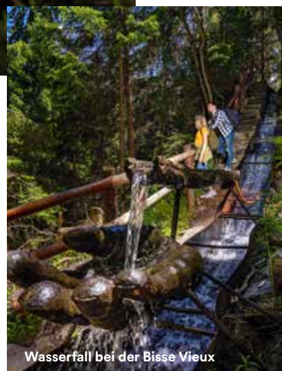
Wasserfall bei der Bisse Vieux

Bei diesem Angebot werden die Gäste mit dem Shuttlebus nach Veysonnaz gebracht und wandern dann gemütlich entlang von zwei Suonen nach Nendaz zurück, wobei auf halbem Weg im lieblichen Weiler Planchouet ein ausgiebiges 3-Gang-Menü aus lokalen Produkten auf sie wartet.