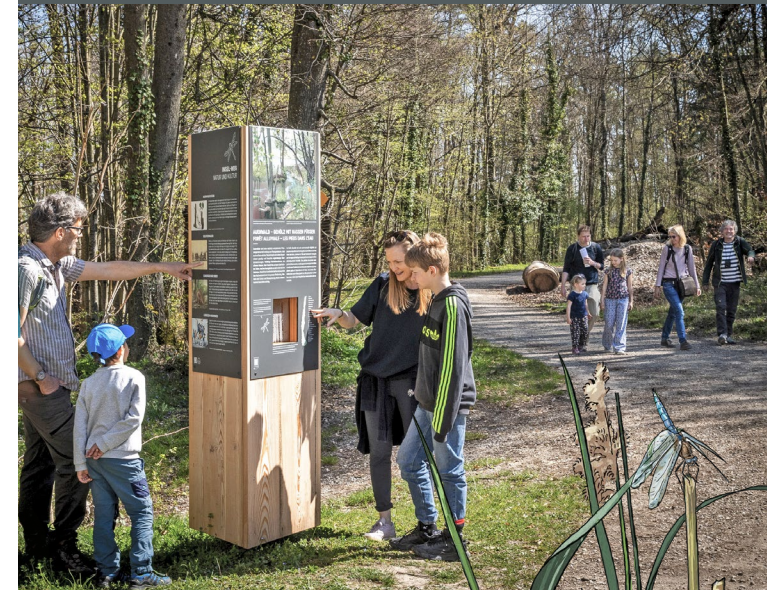
Themenpfad auf St. Petersinsel und Heidenweg