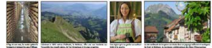
Un escalier en bois, un paysage, une femme, un bâtiment traditionnel de Gruyère.