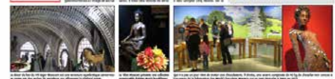
Un arc en pierre, une femme en costume traditionnel, un groupe de personnes, une femme en robe rouge.