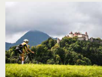
El castillo de Gruyères