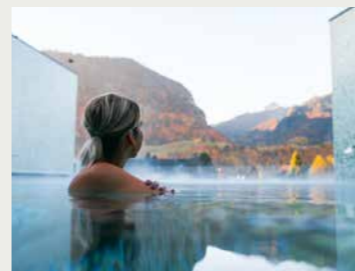
Los Baños de La Gruyère, Charmey

De las atracciones que figuran a continuación, ¿cuáles son los cinco lugares más frecuentados en Friburgo Región? Pruebe suerte en www.fribourgregion.ch/concours . Podrá ganar un abono Magic Pass por valor de 499 francos.