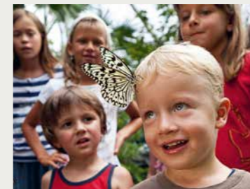
El Papiliorama, Kerzers