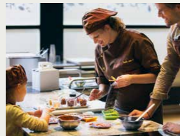
La Maison Cailler, Broc