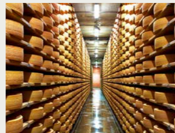
La Maison du Gruyère, Pringy