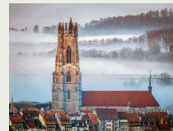
La catedral de Friburgo