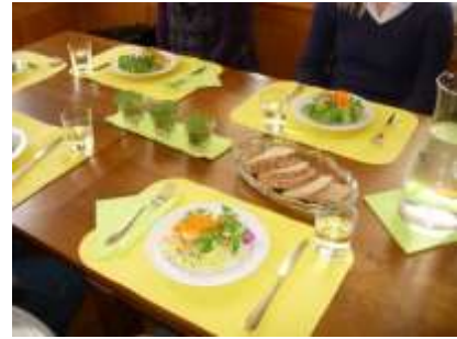
Table d'hôtes et ferme auberge / Gästetisch und Besenbeiz