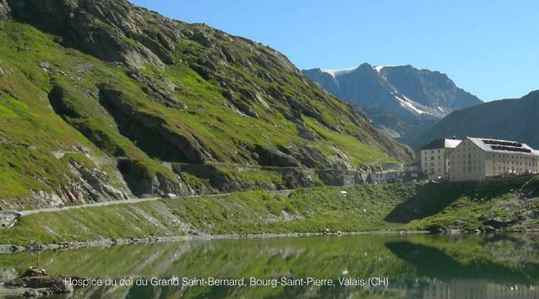
Hospice du col du Grand Saint-Bernard, Bourg-Saint-Pierre, Valais (CH)