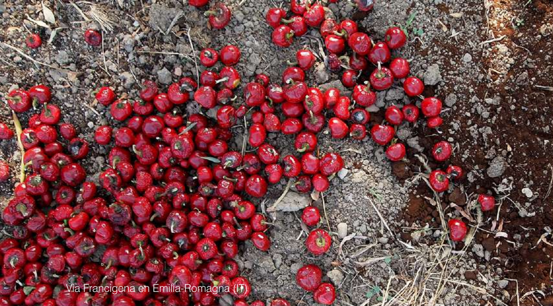
Via Francigena en Emilia-Romagna (IT)