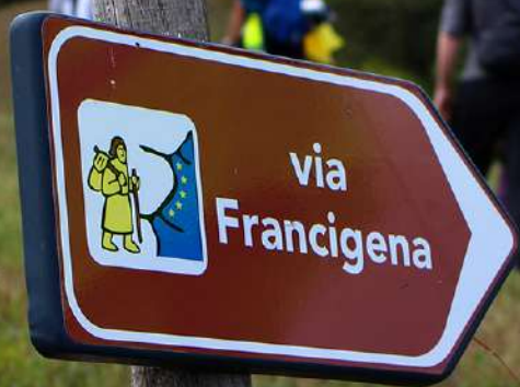
Via Francigena entre Cassio et Berceto, Emilia-Romagna (IT)