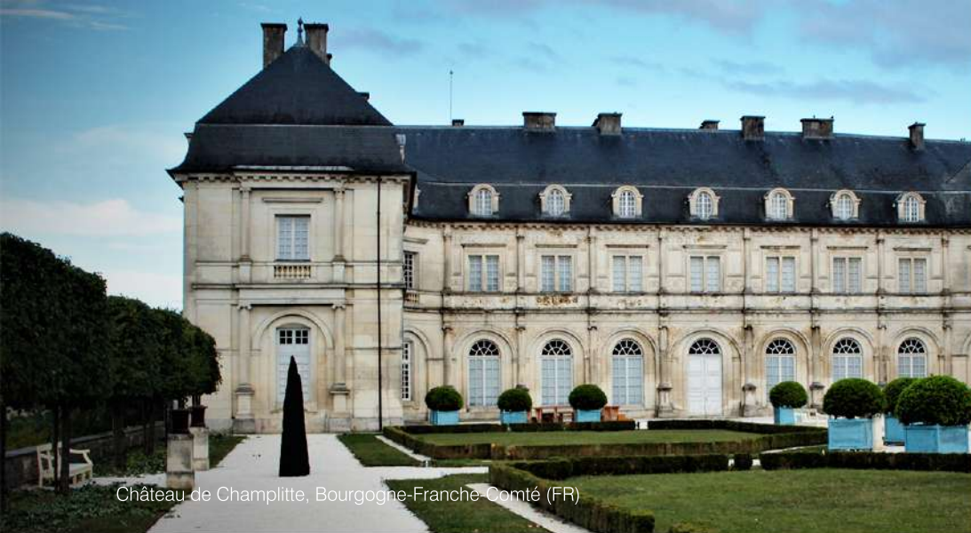
Château de Champplitte, Bourgogne-Franche-Comté (FR)