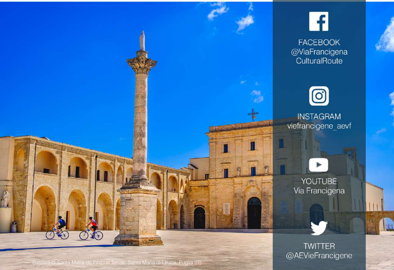
Basilica di Santa Maria de Finibus Terrae, Santa Maria di Leuca, Puglia (IT)