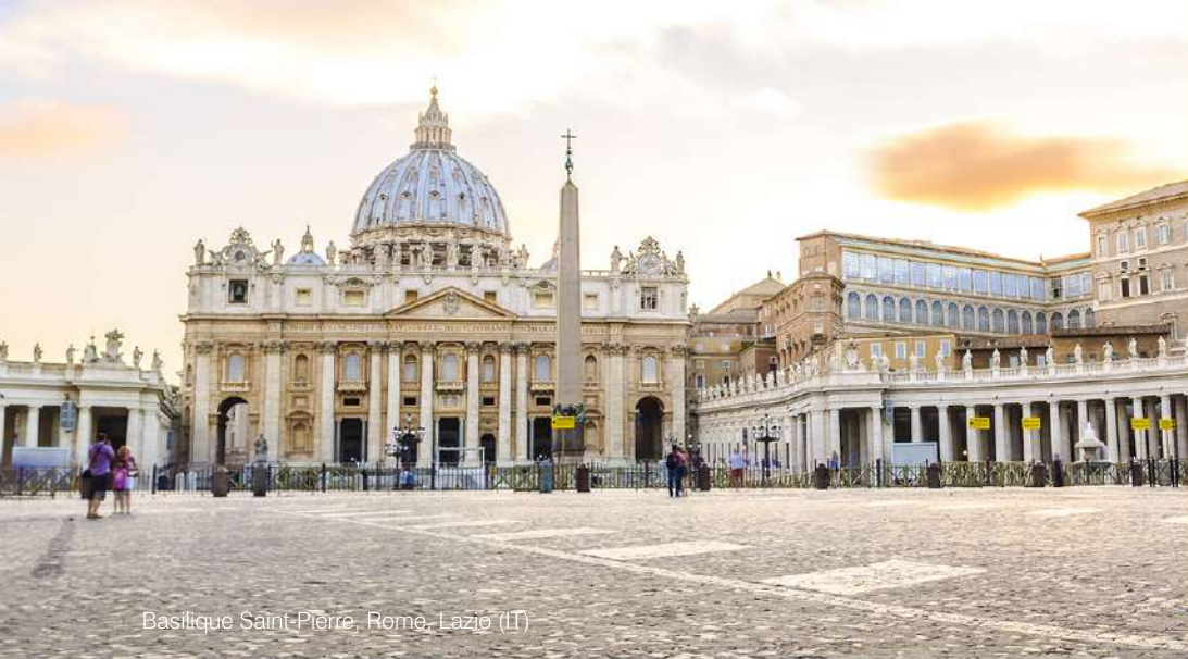
Basilique Saint-Pierre, Rome, Lazio (IT)