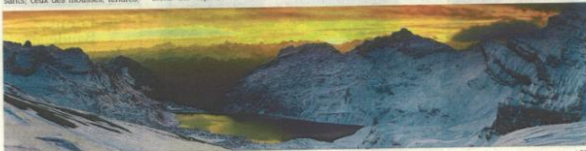
Au Château de Chillon, Samuel Bitton présentera 25 grands formats pouvant mesurer jusqu'à 2m 20.