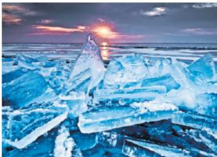
Ice Alive , Minnesota, Etats-Unis, 80 x 54 cm.