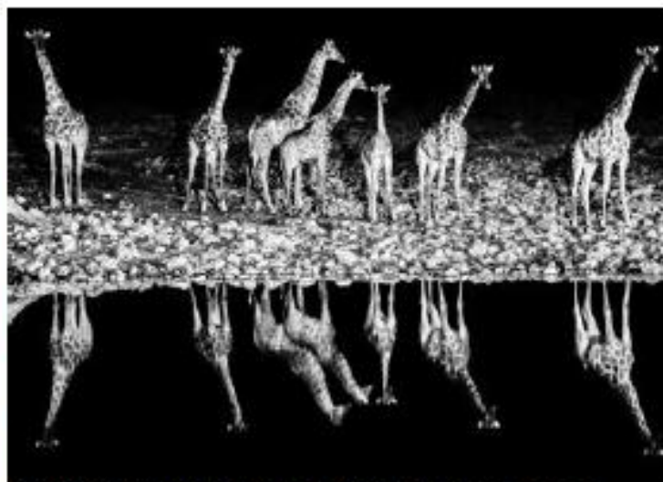
Giraffe Symphony , Namibie, 100 x 60 cm. RAFAEL ROJAS/DR