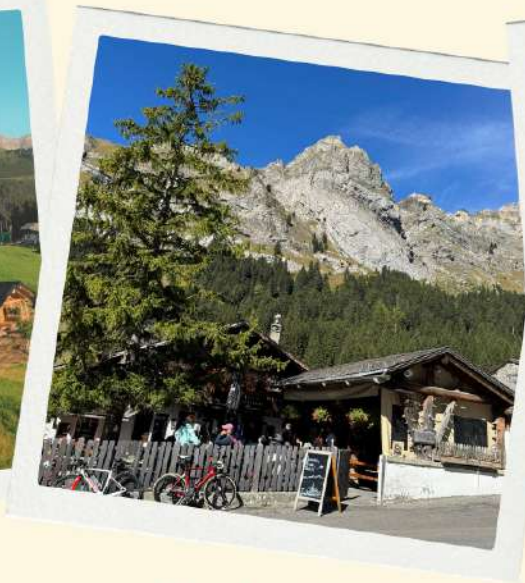
Refuge de Solalex