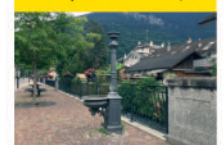
10 Le pont de la Teinture