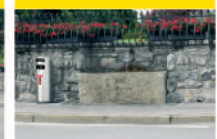
14 La Colonne