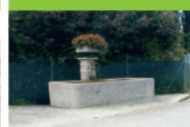
19 L'Alex-Rte du Cotterd