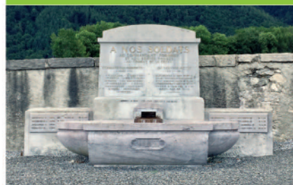
16 Le monument Forneret