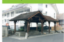
18 Le quartier de l'Alex