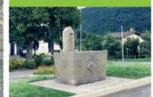
17 L'ancien stand