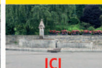
13 Le quartier du Crétel