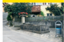
12 La Tour