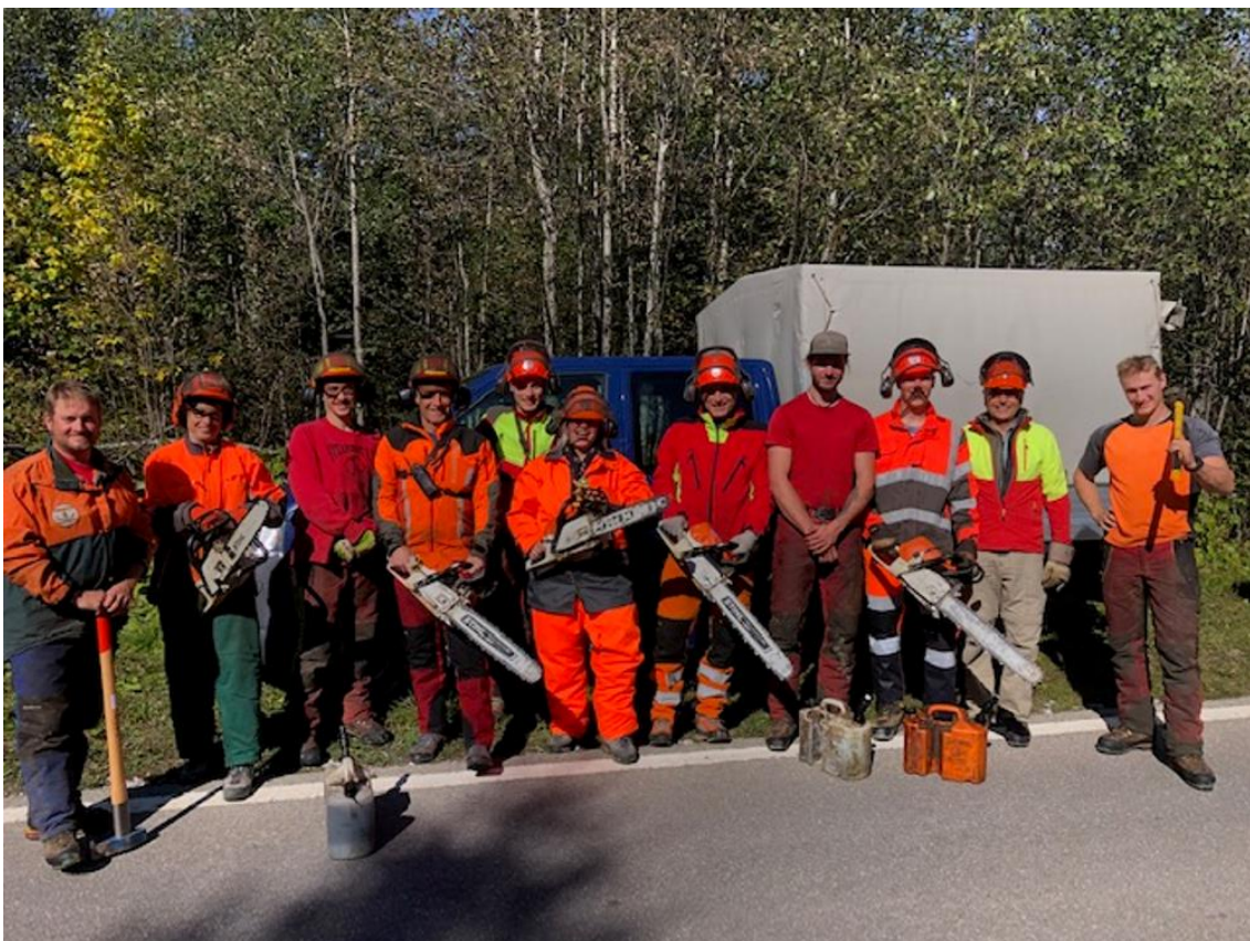
Les bûcherons du Groupement et les membres du Comité Directeur