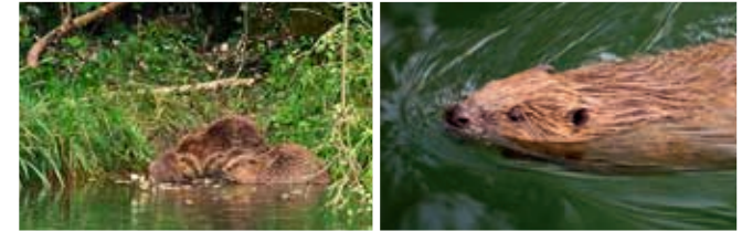
Les castors de l'Orbe sont visibles dans un film (projeté sur demande)

La plaine de l'Orbe, ses étangs et sa mise en culture sont très présents dans les expositions et les films. En 2018, un projet de Troisième correction des eaux du Jura est lancé, du Mormont à Soleure. Il s'agit de lutter contre les changements climatiques qui, si rien n'est fait, pourraient limiter gravement la production agricole du Plateau suisse.