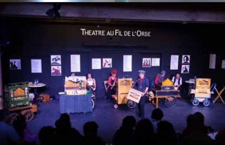
Les Tourneurs de manivelle au théâtre