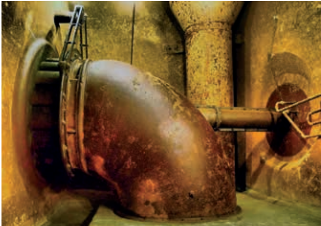
Le site abrite la plus ancienne centrale électrique sur l'Orbe (1891)

Les moulins Rod sont situés sur l'emplacement d'un ancien moulin, dont les murs subsistent à l'intérieur. Une minoterie s'y développa dès 1404, évoluant au rythme des progrès techniques et industriels, fermant définitivement en 1997. Les traces de ces activités sont toujours visibles.