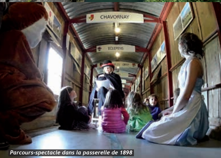
Parcours-spectacle dans la passerelle de 1898