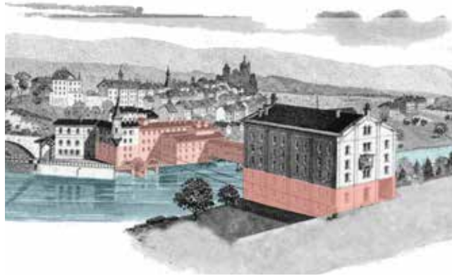
Les bâtiments anciens qui font l'objet d'un projet de sauvegarde