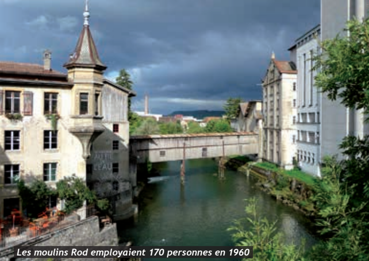
Les moulins Rod employaient 170 personnes en 1960