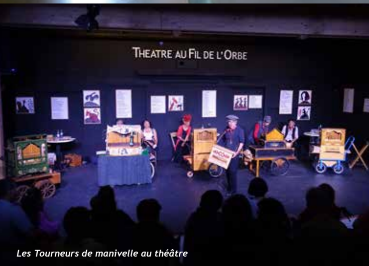
Les Tourneurs de manivelle au théâtre