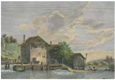
Le premier moulin de 1404, toujours en place

Les moulins Rod sont situés sur l'emplacement d'un ancien moulin, dont les murs subsistent à l'intérieur. Une minoterie s'y développa dès 1404, évoluant au rythme des progrès techniques et industriels, fermant définitivement en 1997. Les traces de ces activités sont toujours visibles.