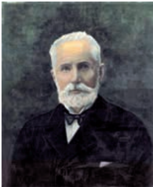
Jules Rod, fondateur des moulins Rod en 1871

Notre association a réhabilité le bâtiment de près de 3000m 2 pour le faire découvrir au public et présenter des expositions, animations et projections d'anciens films qui permettent de mieux appréhender le site et son histoire.