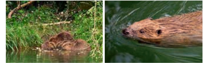
Les castors de l'Orbe sont visibles dans un film (projeté sur demande)

La plaine de l'Orbe, ses étangs et sa mise en culture sont très présents dans les expositions et les films. En 2018, un projet de Troisième correction des eaux du Jura est lancé, du Mormont à Soleure. Il s'agit de lutter contre les changements climatiques qui, si rien n'est fait, pourraient limiter gravement la production agricole du Plateau suisse.