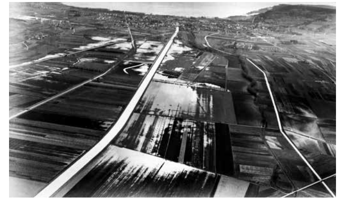
La deuxième correction des eaux du Jura a limité les inondations

MOULIN MOULINE, 6 ème festival au fil de l'Orbe, du 30 août au 8 septembre 2019