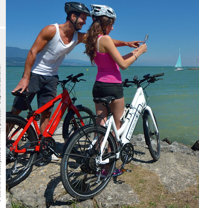
© Couverture: Claude Jaccard, www.vaoud-photos.ch - Graphisme: Zanich.ch

Velotour unter dem Motto «Pack die Badehose ein» In 2 Tagen um den Neuenburgersee