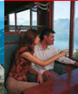
MOB Belle Epoque